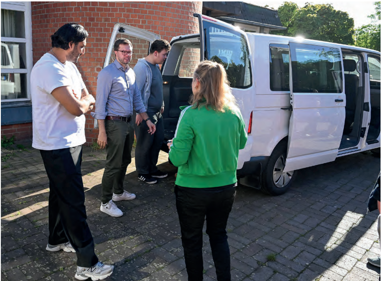
Der neue JUZ-Bus wird von allen Seiten begutachtet

Boxturniere, Schwimmkurse, Ausflüge, Freizeiten, all das wäre ohne einen eigenen Bus kaum möglich. Unser Opel Vivaro war jahrelang treuer Begleiter und hat Generationen von Jugendlichen sicher ans Ziel gebracht. Doch irgendwann kommt das Alter auch beim zuverlässigsten Gefährt: Immer neue Defekte häuften sich, und zuletzt fiel der Turbolader aus. Was das bedeutete? Über keinen Berg mehr ohne Schneckentempo. Es war Zeit, den alten Vivaro in den wohlverdienten Ruhestand zu schicken.