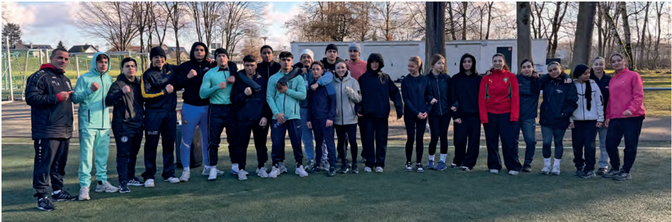
Großes Interesse beim Lauftraining