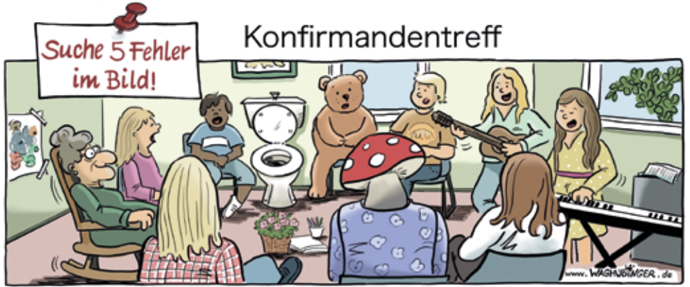
Oma, Toilette, Bär, Pilz, fehlende Klaviertasten