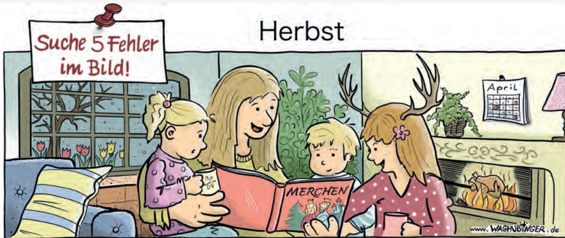
Tulpen, "Merchen", Geweih, April, Brathähnchen